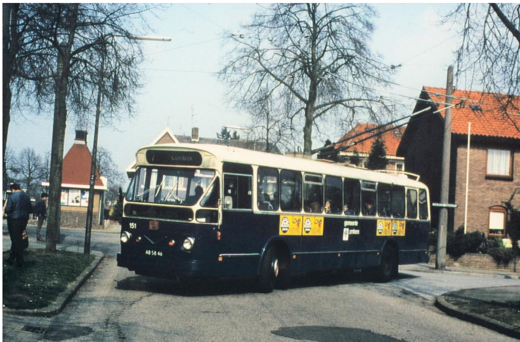
Trolleybus lijn 7 reed tussen 1959 en 1974 via de Bronbeeklaan, de Nicolaas Beetsstraat en de Vondellaan door de Paasberg.

Dat er zoveel masten bij elkaar staan komt omdat er van 1957 tot 1974 een trolleybuslijn door de wijk heeft gelopen. Het was lijn 7, die op 2 juni 1957 werd ingesteld tussen de Wilhelminastraat in Lombok en de Bronbeeklaan. Extra masten waren nodig om de bovenleiding van lijn 7 af te splitsen van lijn 1 en een bocht te laten maken van de Velperweg naar de Bronbeeklaan en van de Vondellaan naar de Velperweg.